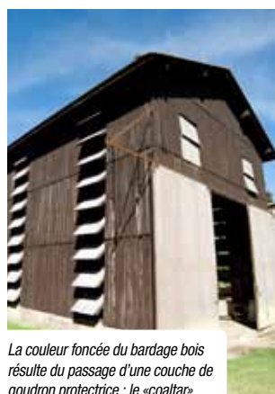
La couleur foncée du bardage bois résulte du passage d'une couche de goudron protectrice : le «coaltar».

Ces étroites silhouettes de hangars en bois sont liées à l'histoire de la culture du tabac. À l'origine (XVII e siècle), les paysans faisaient sécher les grandes feuilles sous le «balet» ouvert de leur maison. Ils ont peu à peu fermé ces auvents à l'aide de planches de bois pour faciliter le séchage. Ce qui empêchait l'air et la lumière de bien circuler à l'intérieur de la maison. C'est pourquoi, avec le développement de la culture du tabac au XIX e siècle, des bâtiments spécifiques ont été construits. Tout a été pensé dans un seul but : optimiser le séchage. Les bâtiments sont hauts, peu larges et dotés de nombreux systèmes de ventilation sur le mur (volets orientables, portes à chaque extrémité) ou en toiture. Ils sont généralement installés dans un endroit bien aéré, sur un soubassement maçonné voire sur pilotis en plaine inondable.