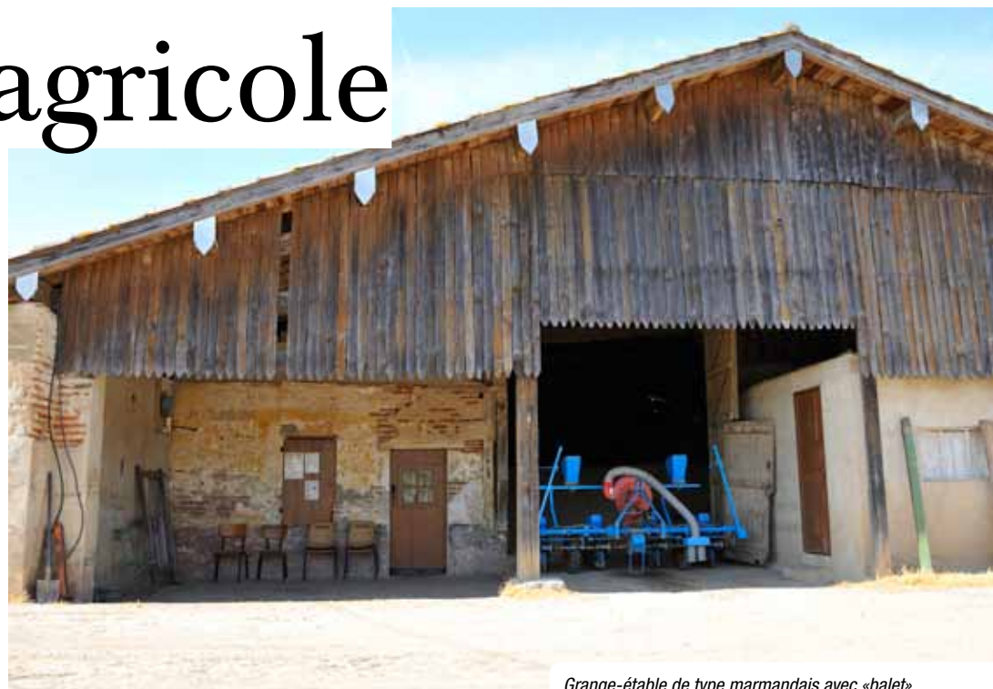
Grange-étable de type marmandais avec «balet».

On distingue en Val de Garonne trois types de fermes, facilement identifiables et ce malgré les rénovations et adjonctions apportées au fil du temps. La grande majorité date du XVIII e ou XIX e siècle (et XX e pour les fermes type «échope bordelaise») mais quelques bâtiments sont plus anciens (XVI e et XVII e siècles).