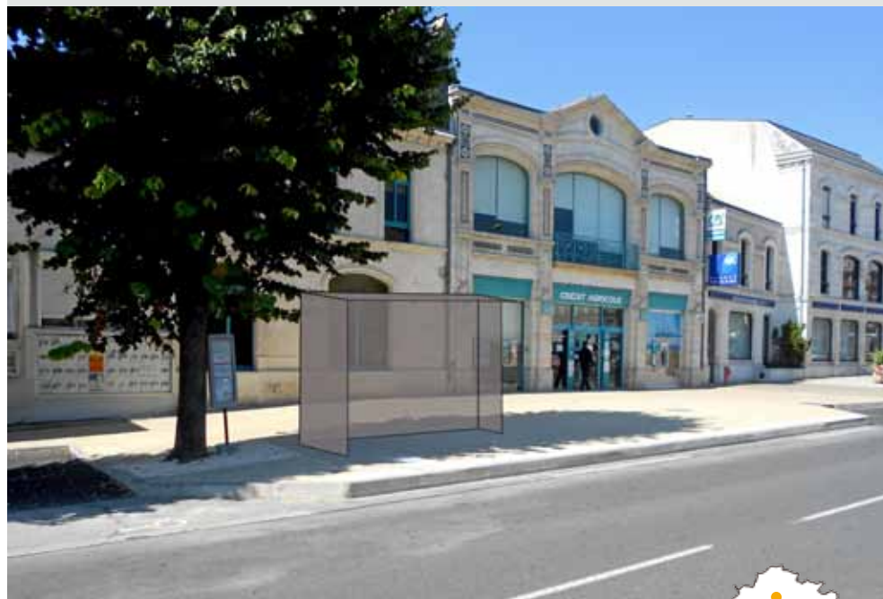
Marmande - Arrêt Fourcade : un des premiers Abribus installés.