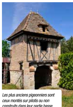
Les plus anciens pigeonniers sont ceux montés sur pilotis ou non construits dans leur partie basse.

Sur les quelque 6 000 pigeonniers du département, le Val de Garonne en compte plus d'une centaine. Avec des formes très variées : carrée, rectangulaire, hexagonale ou encore, mais c'est plus rare, circulaire. On les retrouve soit isolés en pleine campagne, soit intégrés aux habitations, dans les combles ou dans une tour. Cette profusion et cette diversité s'expliquent par l'histoire. Sous l'Ancien Régime, le pigeonnier était un privilège de la noblesse. Après la Révolution française, les paysans vont s'approprier le pigeonnier à la fois comme symbole d'une liberté acquise et témoin d'un certain prestige. Autre élément : l'importance jusqu'au XIX e siècle de la colombine dans l'économie rurale. En effet, avant le développement des engrais chimiques, la fiente du pigeon était utilisée dans la fertilisation des terres pour la culture du chanvre, du tabac et de la vigne.